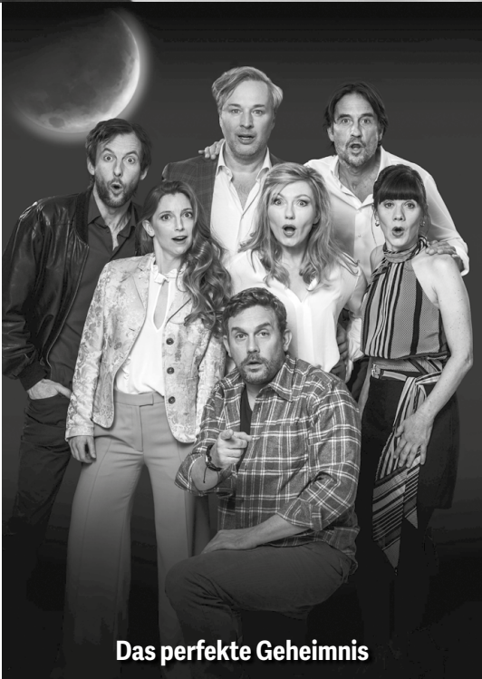
Das perfekte Geheimnis