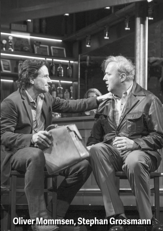
Oliver Mommsen, Stephan Grossmann