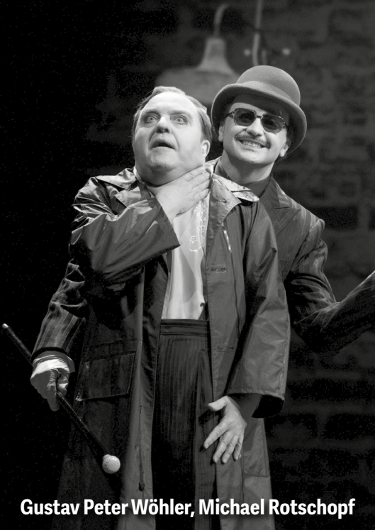
Gustav Peter Wöhler, Michael Rotschopf